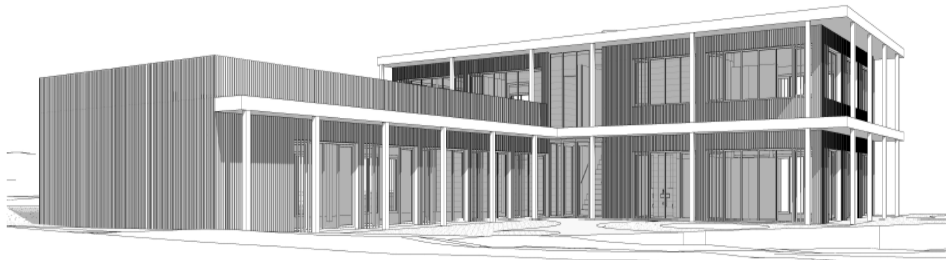
Ansicht von Ecke Bleichestrasse (süd- west) zum Eingang